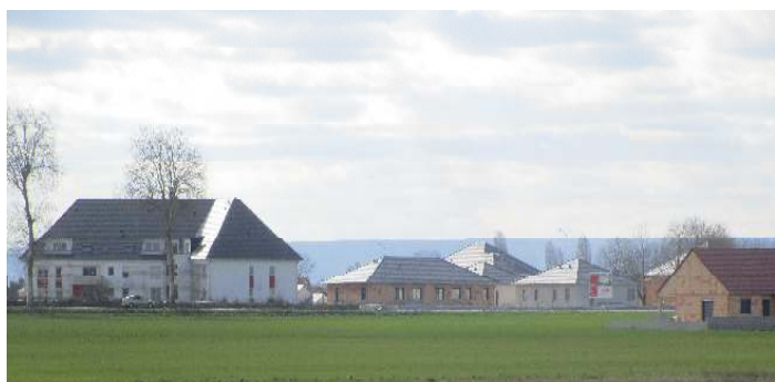
Les constructions nouvelles entre CRIMOLOIS et NEUILLY-LES-DIJON

Ses ressources financières proviennent d'une fiscalité directe locale et d'une dotation globale de fonctionnement.