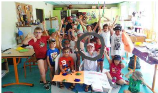
Les enfants au centre de loisirs de NEUILLY

Dans cet esprit, un groupe de travail composé des Maires et des Adjointes s'est constitué afin de donner l'impulsion au projet et de le présenter aux conseillers. Volonté désormais portée par les élus des 2 communes, des commissions de travail vont voir le jour afin de travailler ensemble à l'écriture d'un document fondateur.