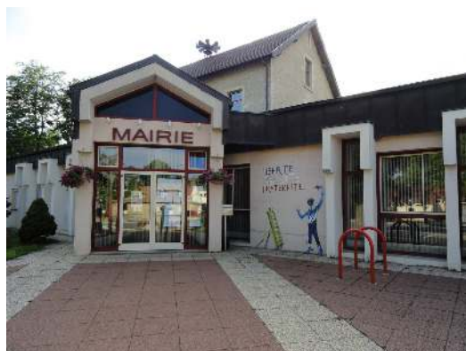
La Mairie de NEUILLY-LES-DIJON

Puisqu'à deux on est évidemment plus forts, la commune nouvelle regroupant CRIMOLOIS et NEUILLY-LÈS-DIJON constituerait la 11 ème commune de la Métropole de par son niveau de population. Elle