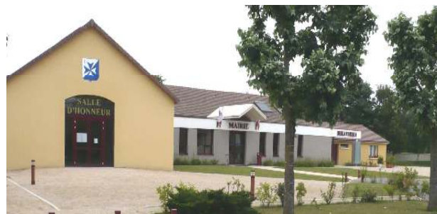
La Mairie de CRIMOLOIS

populations dans un contexte de contraintes financières sans précédent sera facilité.